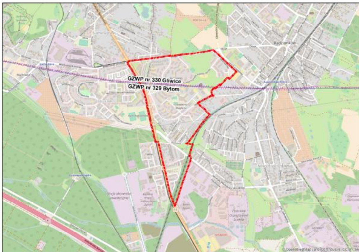
Rysunek 3 Teren opracowania na tle Głównych Zbiorników Wód Podziemnych [1.2.18]

Zgodnie z Aktualizacją Planu Gospodarowania Wodami na Obszarze Dorzecza Wisły [1.2.23] zarówno stan chemiczny jak i stan ilościowy wspomnianej JCWPd określone zostały jako słabe, a możliwość osiągnięcia celów środowiskowych jest zagrożona.