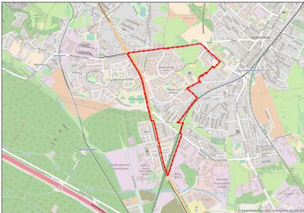
Rysunek 1 Lokalizacja terenu objętego opracowaniem

Teren opracowania o powierzchni ok. 99 ha obejmuje swym zasięgiem Osiedle Generała Jerzego Ziętka w Bytomiu oraz w swojej południowej części zabudowę mieszkaniowo-usługową położoną na wschód od ulicy Strzelców Bytomskich w dzielnicy Stroszek-Dąbrowa Miejska.